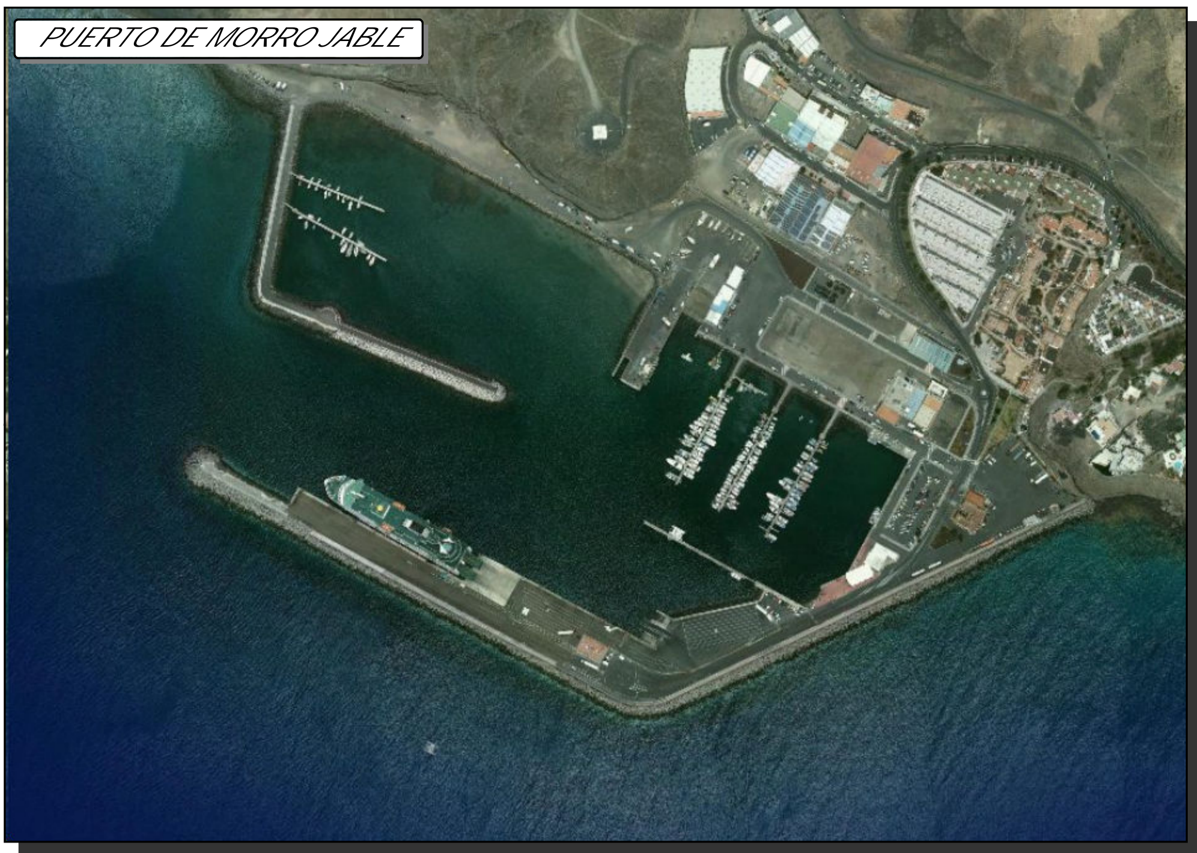
PUERTO DE MORRO JABLE